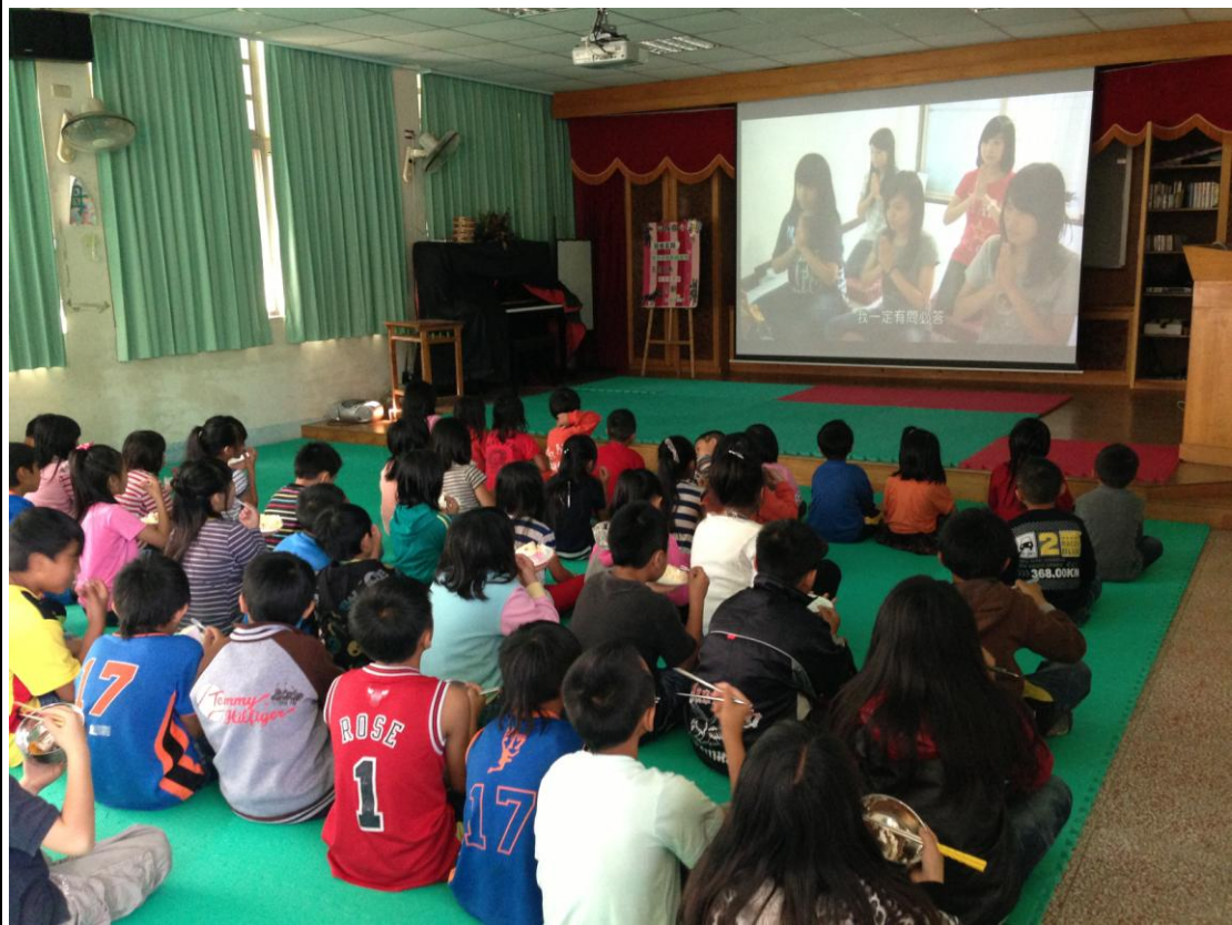
學生專注觀看影片