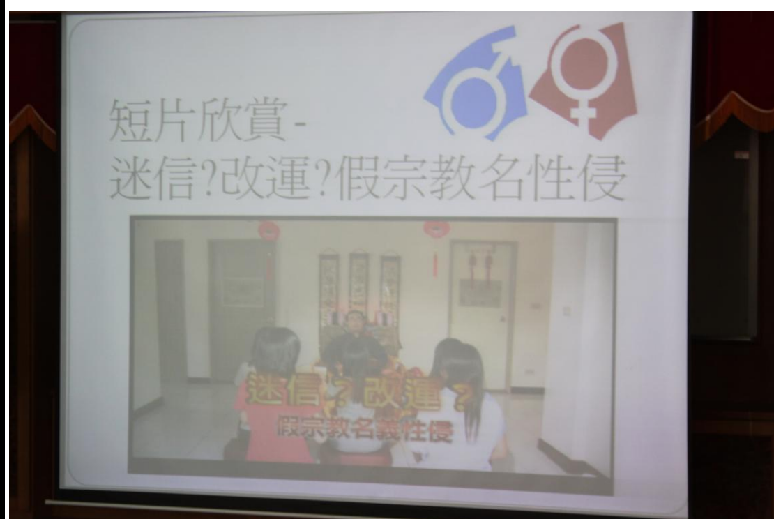
「迷信?改運?假宗教名性侵」影片施教