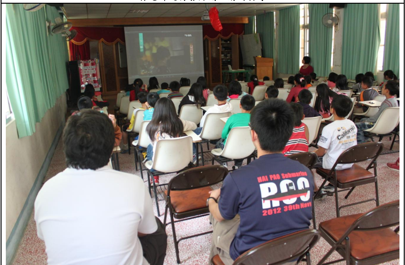
學生專心觀看影片