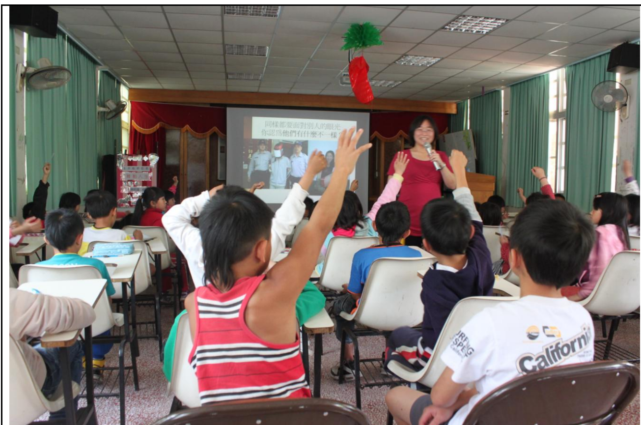
老師提問，澄清觀念