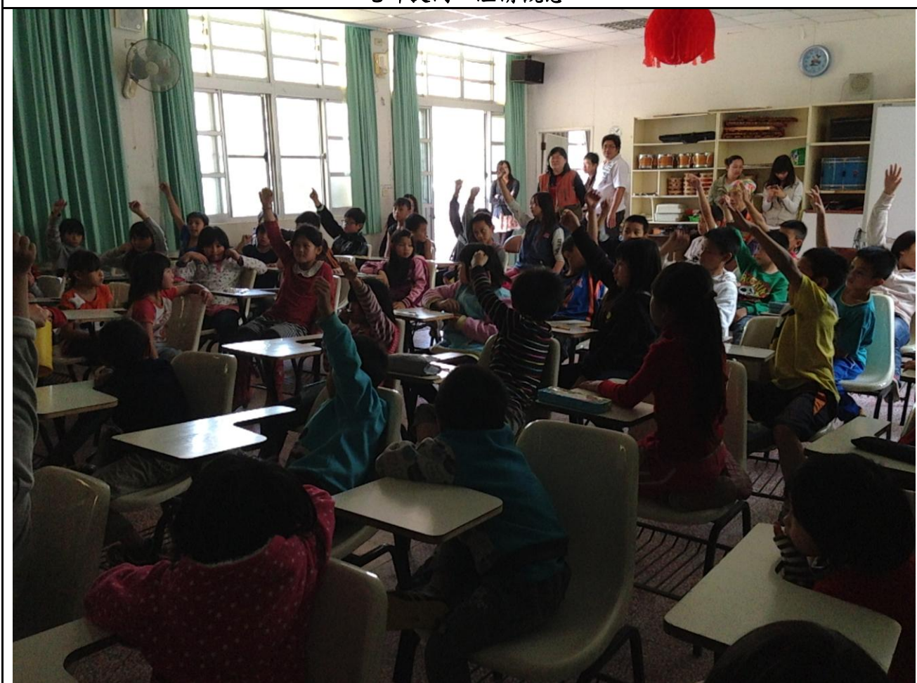
老師提問，澄清觀念