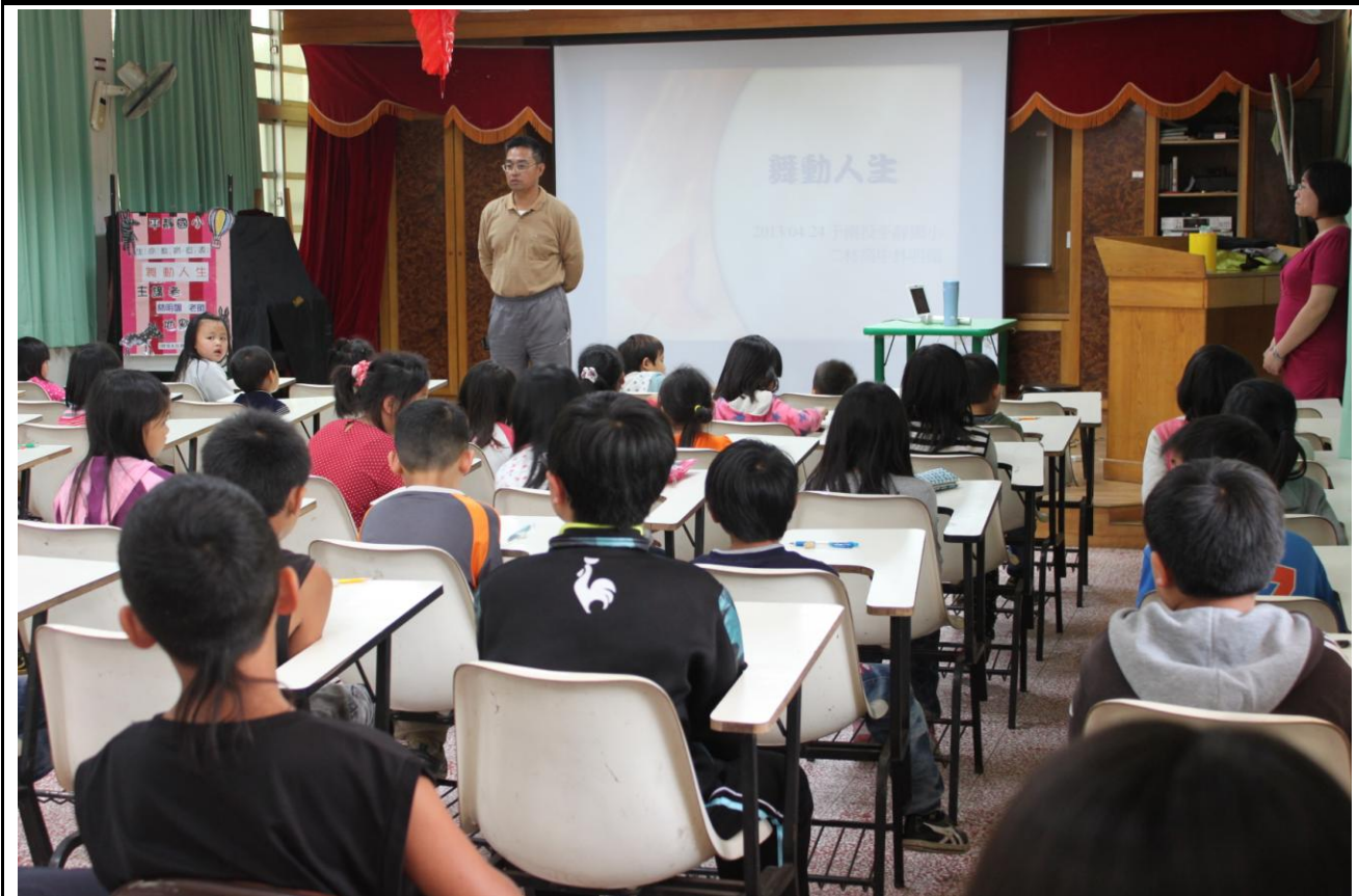
生命教育活動-勇敢且誠實的面對自己的不足-「舞動人生」