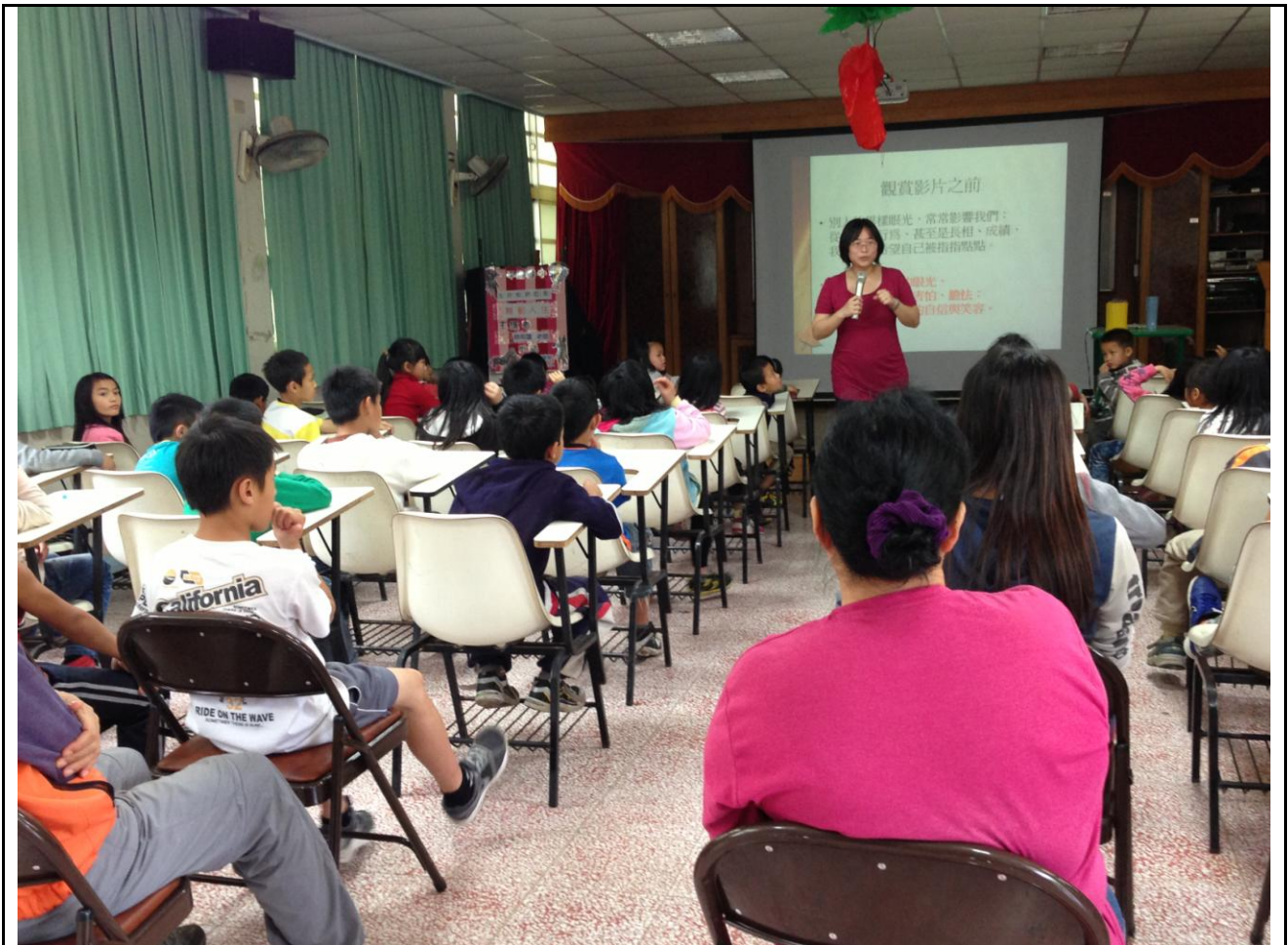
林老師進行影片開始前的引導