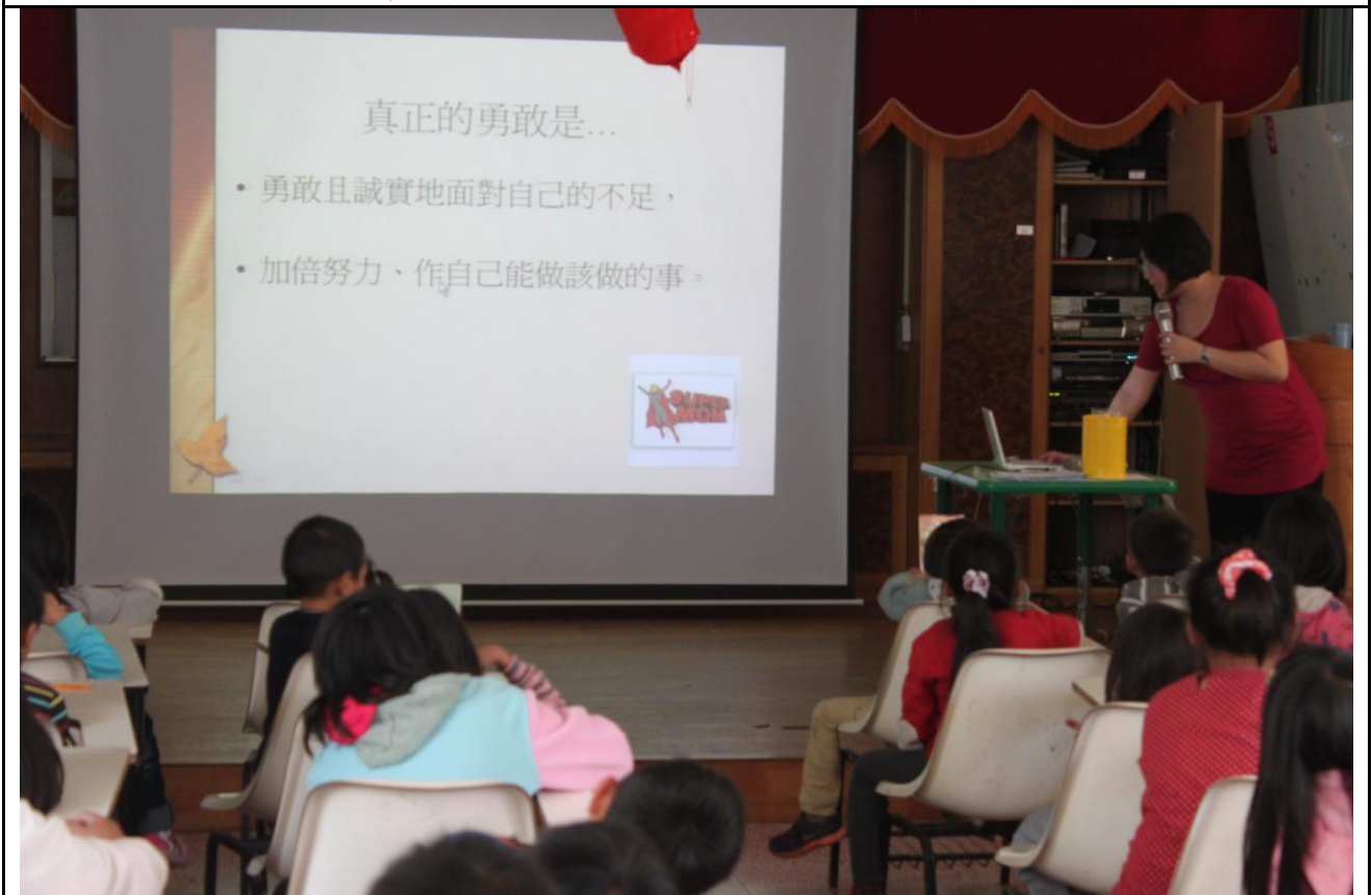
老師提問，澄清觀念。