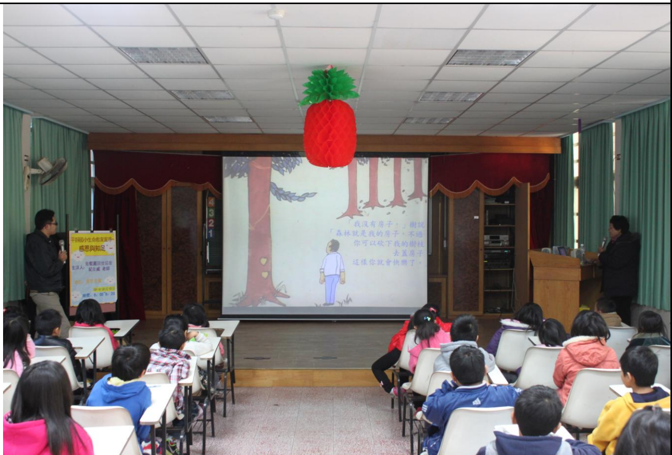
老師進行影片開始前的引導