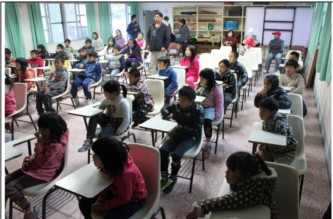
學生專心觀看影片