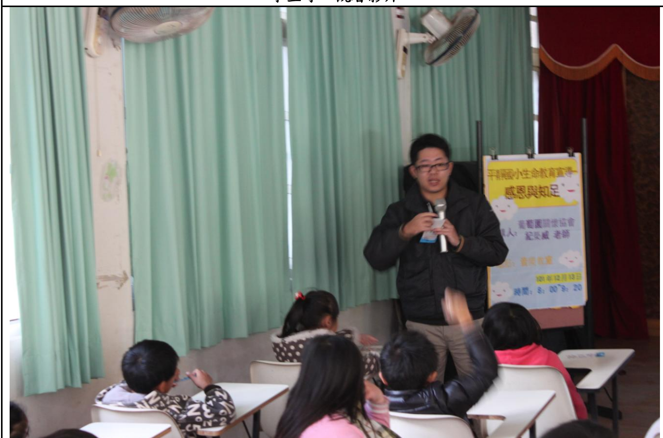
老師提問，澄清觀念。