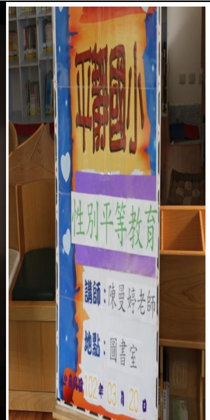
陳老師利用投影片引導生活周遭性平新聞