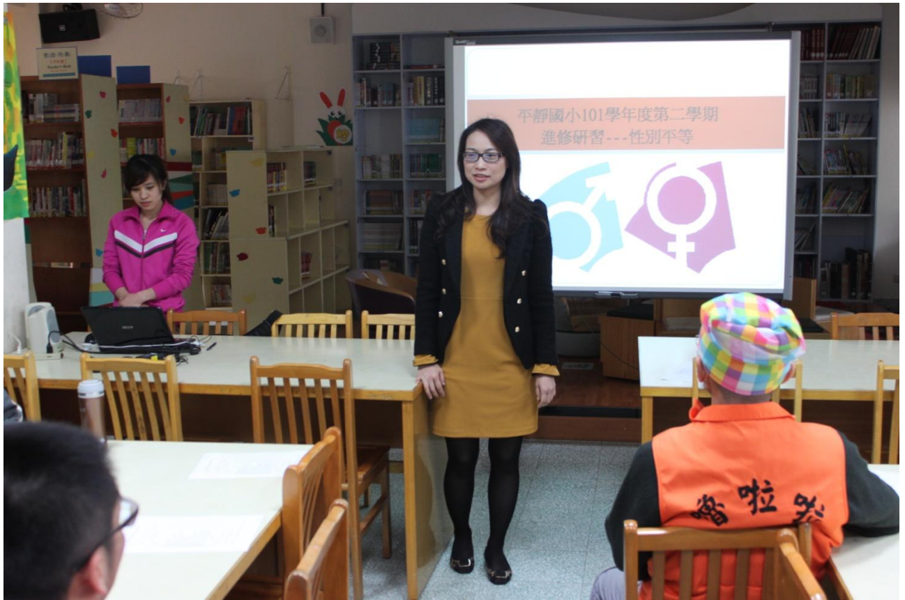
教師輔導知能研習—性別平等。